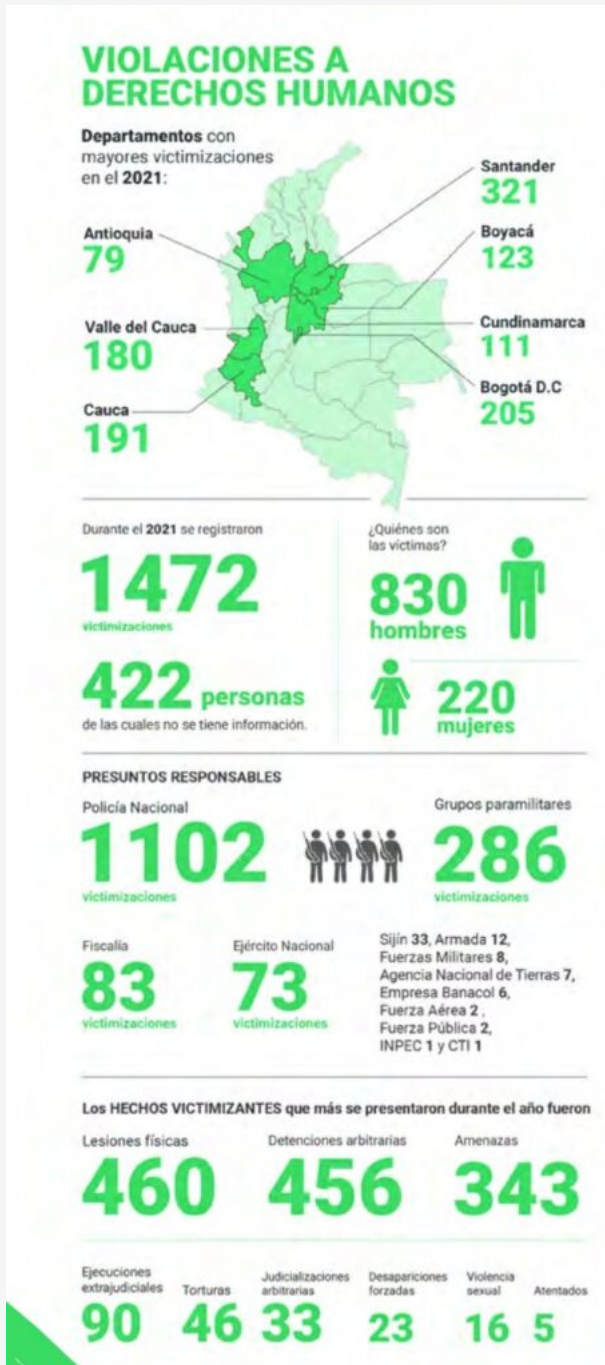
Infografía: Noche y Niebla 64

El estigma como política de Estado Balance del 2021 sobre Derechos Humanos, DIH y Violencia Política en Colombia. El Llano y la Selva: ¿qué está pasando en la Orinoquia?