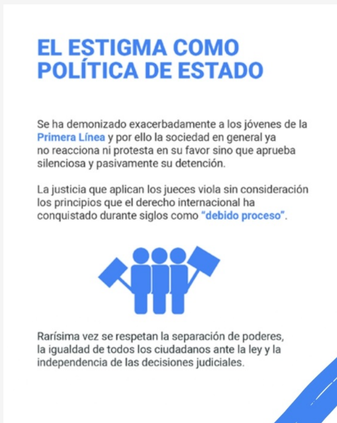
Infografía Noche y Niebla 64

El Banco de Datos de Derechos Humanos y Violencia Política del Cinep/PPP, por medio de la revista Noche y Niebla No. 64, correspondiente al período comprendido entre el día 01 de julio y 31 de diciembre del año 2021, ha registrado información sobre las violencias políticas permanentes en el territorio nacional. Estas violaciones sistemáticas a los Derechos Humanos son una forma de estigmatización al liderazgo social, la defensa del territorio, las movilizaciones y justas protestas sociales.