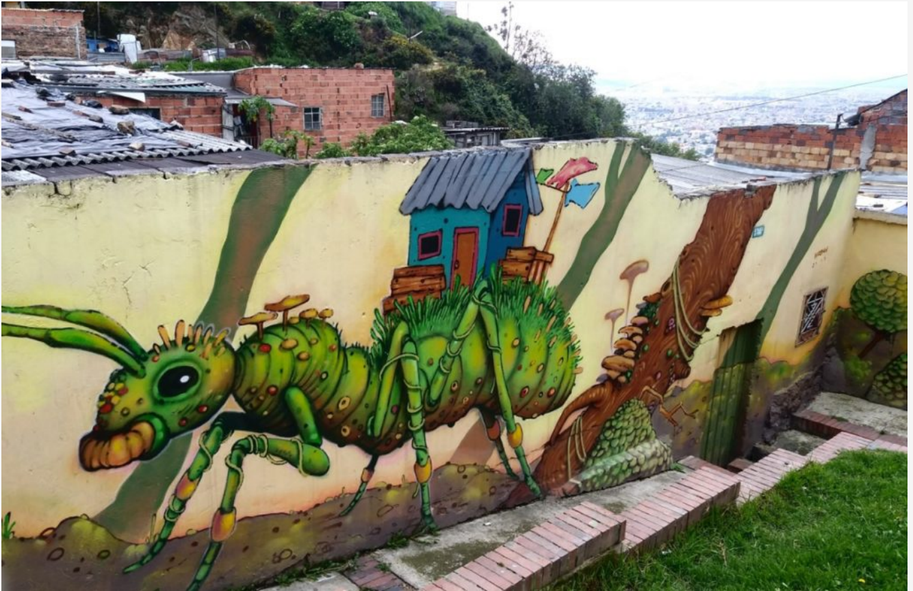
“Hormiga Obrera, con el barrio auestas”. Mural en el Barrio Santa Rosa © 2020.