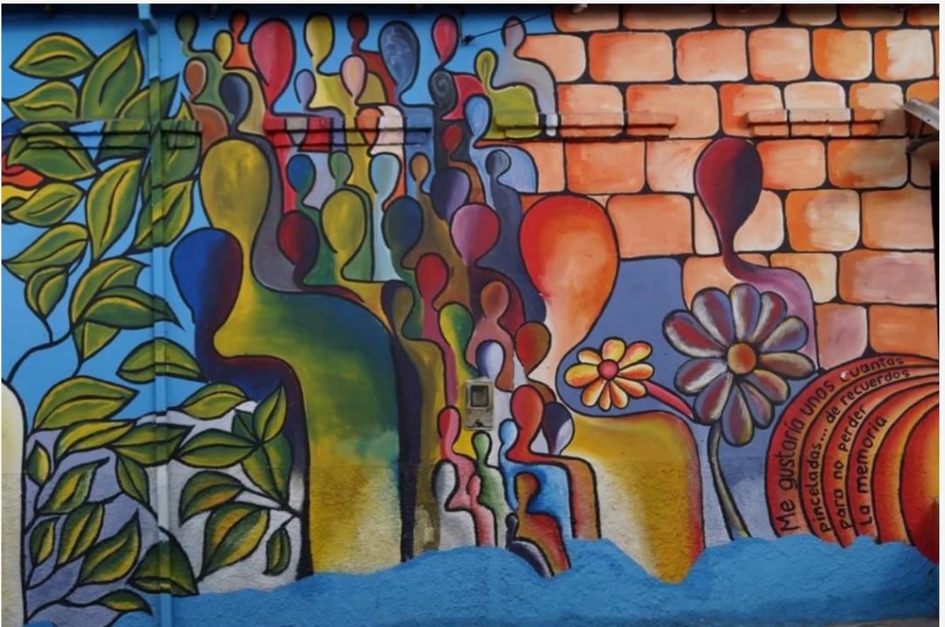
Foto. “Pintura de la Memoria”. Autor: José Jerez. En la Fachada de la Casa de la Cultura Leonardo Gómez. Colectivo Teatral Luz de Luna © 2018. Centro Documental CCH. Ubicada en el repositorio del Centro Documental. Corporación Cultural HATUEY.

De otra parte, mucha gente que vive en la zona, en particular personas mayores de edad tienen que hacer filas en tiendas —sucursales bancarias— para poder reclamar los subsidios que entrega el distrito o gobierno nacional, y con gran dificultad se enfrentan a que el tendero les pida el número de la cuenta de ahorros que jamás han abierto.